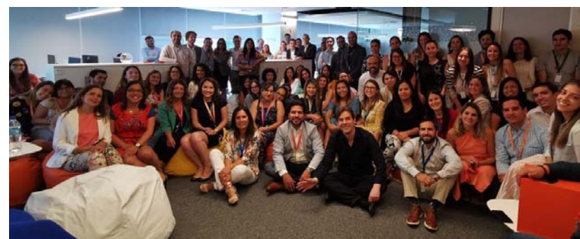
Desde el inicio de la pandemia, Novartis está implementando acciones para apoyar a quienes más lo necesitan.

Como primuma el máximo representante de la compañía en Chile adelantó que suministrarán la tecnología de carga rápida en los pit stop para la próxima generación de autos eléctricos de carrera, los Gen3. Esto en la temporada 9 de la ABB Fórmula E que se llevaría a cabo entre 2022 y 2023.