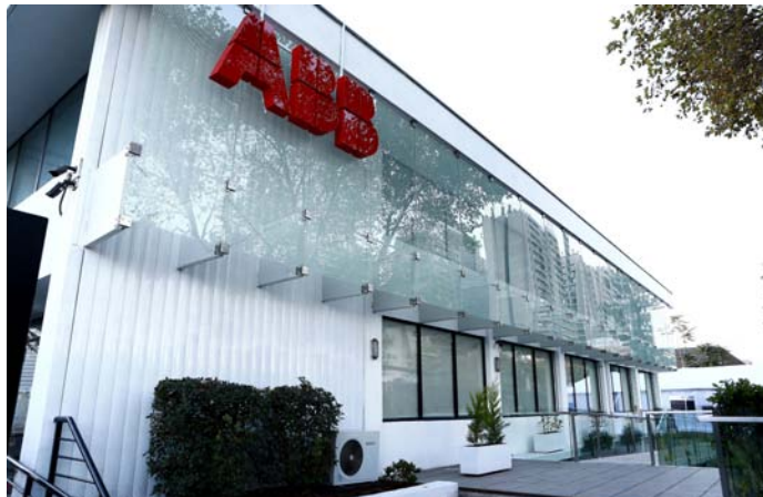
ABB confirmó que sus estaciones de carga rápida suministrarán energía eléctrica a los bólidos de la temporada 9 de la Fórmula E.

"Tenemos una larga tradición en el mercado de procesos industriales claves como proveedores de tecnologías, equipos, soluciones digitales y servicios. En los últimos años hemos comenzado a tener una importante presencia en