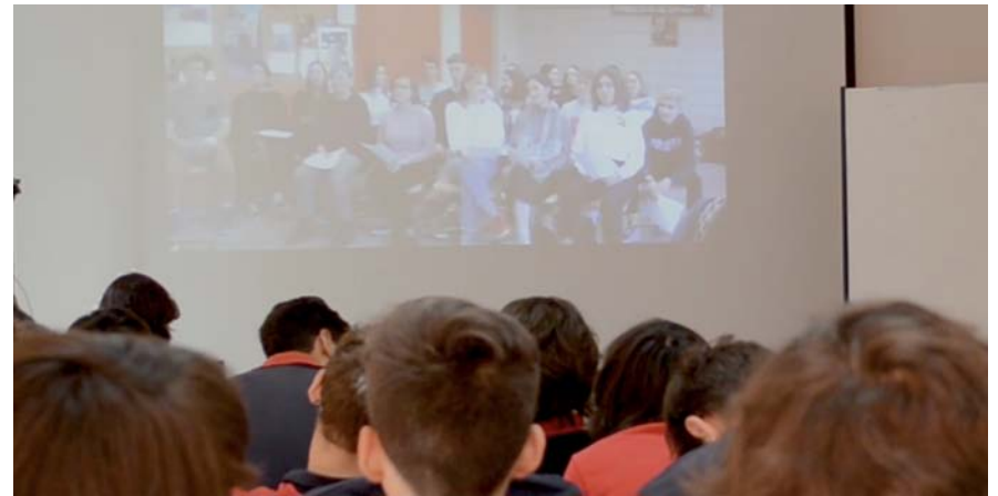
Alumnos chilenos en uno de los diálogos.

Entre las distintas ideas de soluciones sugeridas, se encuentran los proyectos "Guardianes del ecosistema", "Ducha caliente solar" o "Sistema escolar auto-gestionado de reciclaje". Para la compañía suiza, el medio ambiente y los jóvenes son temas muy relevantes. NESTLÉ impulsa internacionalmente la Iniciativa por los Jóvenes, para potenciar su empleabilidad y desarrollo, y comparte con ellos la aspiración de un futuro más saludable para el planeta.