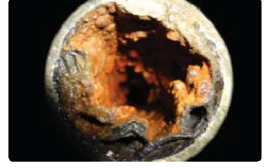
Kontrol tüpünün Aqua-4D® montajından önceki görüntüsü

Bu uygulama yüksek düzeyde su tüketimine neden olur, sudaki tuz oranını artırır ve sağlık için riskler oluşturur. Yıllık yaklaşık 10% düzeyinde durulama suyu kullanımını artırır.